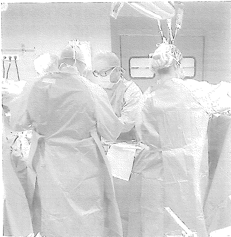
Intervención con motivo de una donación. :: HOSPITAL DE PONIENTE

En este punto, el coordinador de la Unidad de Trasplantes subrayó que si bien un trasplante de tejido