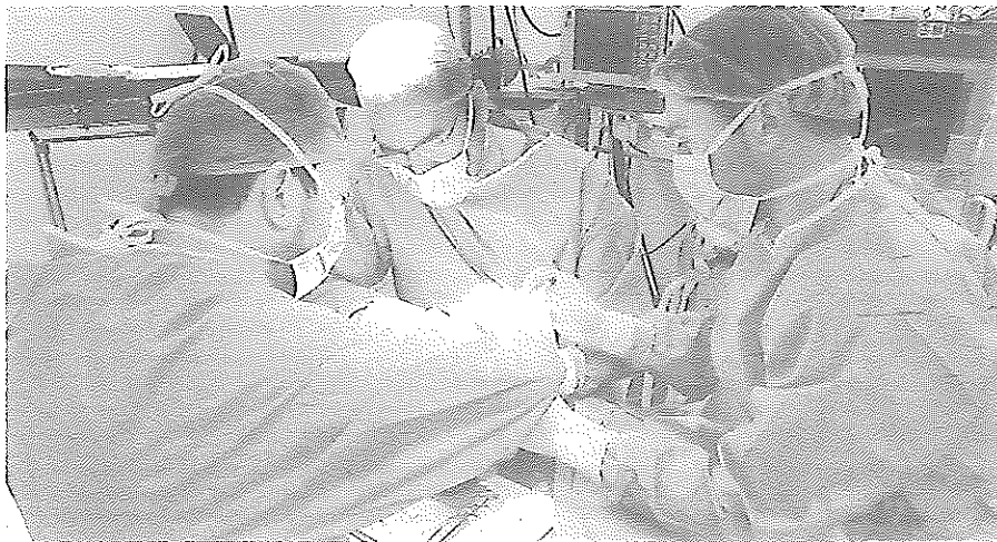
EN 2019 se espera aumentar el número de donantes del Poniente en un 50%.

No obstante, además de los buenos resultados, uno de los hechos más destacables de este balance es el aumento de la edad media de las personas donantes, que actualmente es de 68 años y fluctúa entre los 61 y los 81. Respecto a este cambio de tendencia, el Coordinador Hospitalario de Trasplantes explica que está motivado por el aumento de la calidad de vida con la que se alcanza