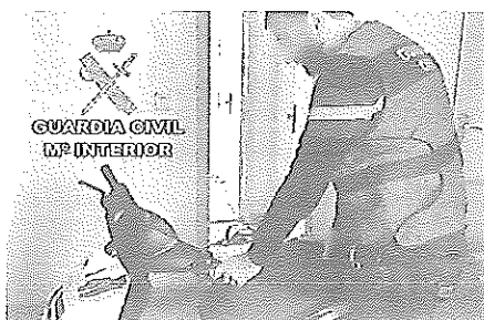
Junto a uno de los ciclomotores sustraídos.

Agentes de la Guardia Civil de Almería han llevado a cabo a mediados del presente mes de enero la detención de dos menores de edad de 16 y 17 años, vecinos de Roquetas de Mar, como pre-