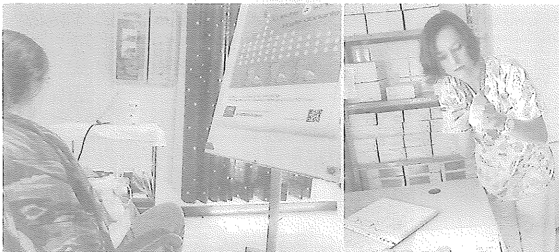
MADRE durante el proceso de donación y profesional sanitaria realizando la clasificación de la leche materna donada en el Hospital de Poniente.

En este sentido, cabe reseñar que el Hospital del Poniente dispone en sus instalaciones de El Ejido de un potente banco de leche que cuenta con la colaboración regular de entre ocho y nueve madres que se pusieron en marcha hace un año.