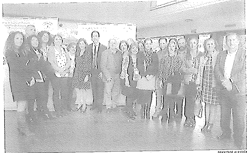
Autoridades en el XI Encuentro de Inmigración y Salud.

El encuentro centró su undécima edición en el análisis del trabajo conjunto que el sistema sanitario, las administraciones locales y las ONG y asociaciones llevan a cabo para acercar la salud a las personas migrantes.