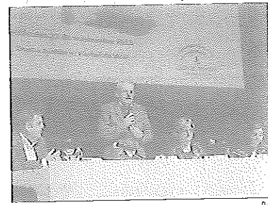
El alcalde en su intervención.