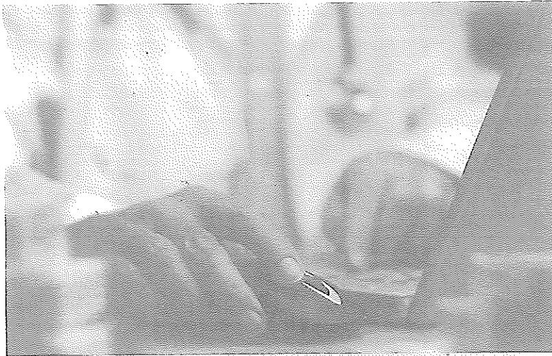
Un profesional sanitario consulta su ordenador.

Los hechos se remontan al año 2013, cuando una paciente del centro de salud Virgen del Mar de la capital ubicada en la calle Haza de Acosta fue diagnosticada de endometriosis y adenomiosis, patologías por las que fue intervenida quirúrgicamente durante el mes de junio del citado año. Posteriormente, cuando llegó el momento de su consulta de revisión, «la facultativa no pudo constatar que hubiera sido previamente intervenida» debido a que «su historia estaba mezclada con la de otra paciente», según indicó en aquel momento la profesional sanitaria «por boca» a la usuaria del sistema sanitario público quien, desde estas circunstancias, solicitó su historial clínico.