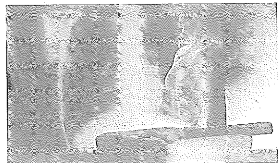
Un cenicero con cigarrillos, una de las principales causas de cáncer.

Conocidos los datos del último trimestre, se puede realizar un balance total de los fallecimientos producidos el año pasado en la provincia almeriense. De acuerdo a los datos del citado instituto andaluz, durante 2017 fallecieron por distintas causas en Almería 5.049 personas, sien-